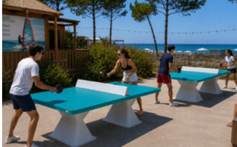
Plateau Resitec HD 60

Parc du Terlon - 9 rue de l'Europe - 31850 Montrabé T. 05 61 84 59 37 - info@loisirs-exterieurs.fr